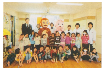
防犯キャンペーン