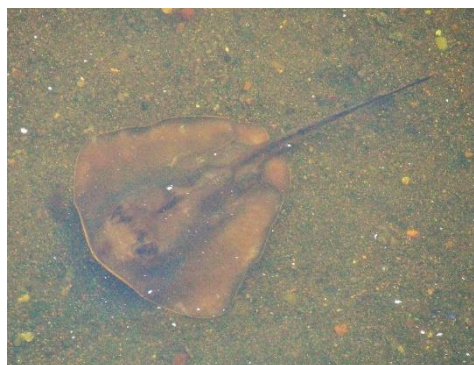
エッ？ イッ！（片瀬川にて）

地域の中でも自立支援のため様々な企画が行われています。これからはまだまだ元気な高齢者の方が地域の中で活動し、お互い支えあう仕組みづくりが必要ではないかと思ひます。