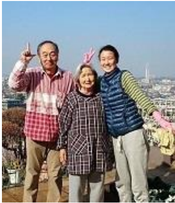
(窓ふき後の記念撮影)

「もしもの時にとっても、ポストに入っていた『しおさい通信』を保存していました。たまたま長時間買い物で外出することになり、介護というほどではないのですが、留守中に家族の付き添いをどこにお願いしようか困りました。そこで通信を思い出したんです。数時間、お話し相手をしていただいて、とても助かりました。」