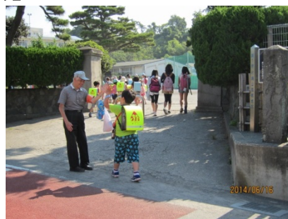
【片小校門前での活動の様子】

一方で、雨の日も雪の日も休まず立ち続けるにはもう少し人数がいれば…とのこと。地域の方たちと一緒に子どもたちの成長を見守るボランティアが増えると良いなあとおっしゃっていました。興味のある方は是非JJBCまでお声掛け下さい。