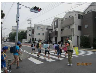
【通学路での活動の様子】