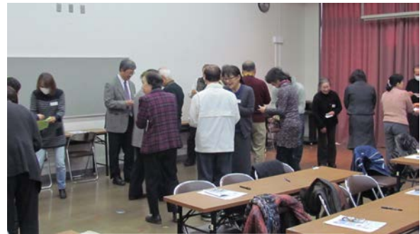
【名刺交換ワークの様子】

JJBC は、まだまだ模索しながらの活動ですが、小さな一歩を重ねながら 新年度も地域の皆さんがいきいきと輝く毎日をご過ごせるよう努力してまいります。