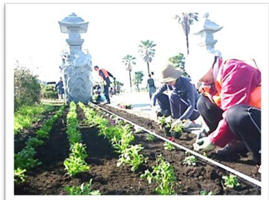
【秋の花植え作業の様子】

尚、一番近い活動日は 11月4日(日) 9:30~ 弁天橋花壇にて行っております。詳しいお問合せは片瀬市民センター地域担当(27-2711)まで。